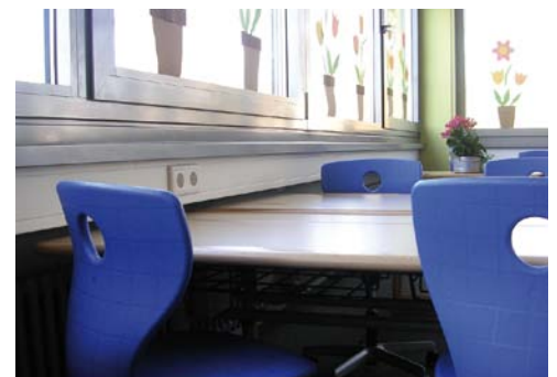
Acabamento em cor alumínio de série. Pode ser pintada.